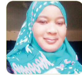
بقلم : أميرة أبكر يعقوب

وإذا ما أحسنت دراسة هذا المقترح في ورش عمل وحلقات مدارس وندوات تخطيط علمي حسنة الإعداد فسنكون قد وصلنا إلى الضوء الساطع في آخر النفق الذي أدخلنا فيه العنف الطلابي والصراع السياسي والتطرف الفكري والعقدي والشذوذ السلوكي والمخدرات إلى باحة المعرفة والإبداع والانطلاق الثقافي والفني برؤية علماء مستشرقين ينظرون لمستقبل شبابهم بوعي بالوحدة القومية والتحصين الفكري الإستراتيجي. وفي ذلك اليوم الذي يتحقق حلم هذه الشراكة الثلاثية الأبعاد نكون قد شيعنا الطوب والحجارة والملوتوف والسيخ والأسلحة البيضاء والعنف اللفظي والضغائن إلى مئوآها الأخير بمقابر الجاهلية الأولى .. وينتهي العزاء بانتهاء مراسم التشييع للجهاالة الجهلاء والضلالة العمياء الذي سؤ وجه أشرف مؤسسات العلوم والآداب والفنون .. والحمد لله من قبل ومن بعد .. وما تشاؤون إلا أن يشاء الله رب العالمين.