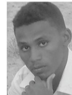
موسى الهادي عبدالله

الطائرات والقطارات واصبحت كل الشركات والمؤسسات المحلية في علاقة مفتوحة مع الشركات الاجنبية وعقب رفع الحظر حدث نقل اقتصادي كبير واصبحت السلع في متناول المواطن البسيط وباتت امال الشعب السوداني كبيرة جدا في التطوير والتنمية المستدامة ورفع مستوى المعيشة ولم يعد من الدول الراعية للإرهاب كما كانت تظن امريكا بل بلدا امنا (استقرار وسلام) ذلك البلد الذي كان وما زال قبل الحظر وبعد رفع الحظر واستطاع ان يثبت لامريكا وترامب والعالم اجمع بانه بلد امن وسلام ونهني رئيس الجمهورية عمر حسن احمد البشير على هذا الانجاز العظيم وكل الشعب السوداني الوفي برفع العقوبات الامريكية وبقول اليوم اجمل والقادم احلى بإن الله وان مد لنا في العيس سنتواصل