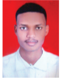
بقلم: المكاشفي مهدي

تعتبر الخطبة أول مراحل الزواج لغرض المعرفة بين الطرفين وفق المبادئ القرآنية والسنية التي تحفظ كيان الرجل والمرأة من ناحية الدين والأخلاق التي وصانا بها رسول الله صلى الله عليه وسلم ولكن كثيرا من الشباب في هذا العصر أصبحت نظرتهم لا تليق بنا بوصفنا مجتمعا إسلاميا تحكمه مبادئ وأحكام ونسوا أن العفاف والأخلاق والاستقامة هي أساس الزواج وأن معرفة الحقوق والواجبات هي