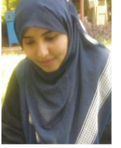
بقلم: نسبية أحمد عثمان

وصدق من قال: إن التواضع من خصال المتقي وبه التقى إلى المعالي يرتقي