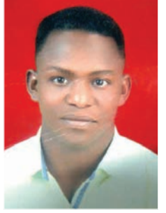
بقلم : إسماعيل أحمد محمد البشير

قال رسول الله صلى الله عليه وسلم ( من تشبه بقوم فهو منهم ) تعريف التقليد الأعمى : هو إتباع المسلمة للكفار أو الفاجرات والأخذ منهم والتشبه بهم دون إدراك أو نظر أو تمحيص . ويفهم من هذا، أن التقليد الأعمى صفة نقص