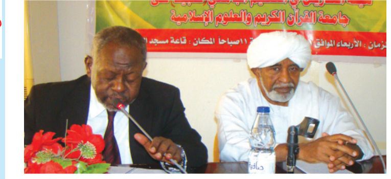
هيئة التدريس وجامعة القرآن الكريم وكيفية عملها في ترقية أداء أعضاء هيئة التدريس، تفاصيل ص ٢