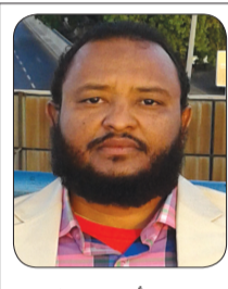
بقلم: أ. عبد الملك القاسم أحمد

تعريف الاحترام لغةً: من حرم أي منع، ويقال حرم الشيء عليه أي امتنع عنه ( قَالَ تَعَالَى: يَا أَيُّهَا النَّبِيُّ لِمَ تُحَرِّمُ مَا أَحَلَّ اللَّهُ لَكَ تَبْتَغِي مَرْضَاتَ أَزْوَاجِكَ وَاللَّهُ غَفُورٌ رَحِيمٌ ) التحريم (١). وقوله سبحانه وتعالى: (لِمَ تُحَرِّمُ، أي لم تمنع نفسك. وسمى بيت الله تعالى: بالبيت الحرام، لأن الله سبحانه وتعالى حرم القتال فيه، ولأنه يمنع فيه فعل بعض الأشياء الجائز فعلها مثل الصيد وأخذ اللقطة، وذلك تعظيماً له وزيادة لحرمة.