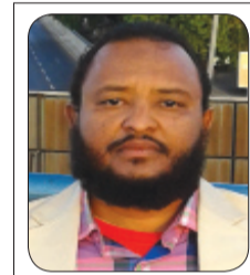
بقلم: أ. عبد الملك القاسم أحمد

حَمِيمٌ فصلت (٣٤). ٤- الوفاء بالنذر وذلك بالقيام بآدائه. النوع الثاني- الوفاء بين العبد وأخيه المسلم: وله صور عديدة يمكن ذكر أهمها فيما يلي: ١- الوفاء بالوعد والعهود والعقود: قال تعالى: (يَا أَيُّهَا الَّذِينَ آمَنُوا أَوْفُوا بِالْعُقُودِ) المائدة (١)، ومنها الوفاء بالدين في وقته المحدد. ٢- الالتزام بالمواثيق والشروط: ومنها الالتزام باللوائح والقوانين والإجراءات، ومنها أداء مهر النساء، فعن عقبة رضي الله عنه عن النبي صلى الله عليه وسلم، قال: (أحق ما أوفيتم من الشروط أن توفوا به ما استحلتم به الفروج) ٣- عدم الأخذ بالثأر وعدم ظلم الأبرياء: قال تعالى: (وإبراهيم الذي وفى) * أَلَا تَرَى وَأَرْزَ وَرَزَّ أُخْرَى النجم (٣٧-٣٨) فقوله تعالى: (أَلَا تَرَى) أي: لا تعاقب نفسك، (وَأَرْزَ): والوازرة هي النفس، (وَرَزَّ أُخْرَى) ، أي بذنب أو جريرة نفس أخرى. ومن أمثلة ذلك ألا ينحاز الإنسان عند حدوث خلافات بين صديقه مع آخرين أو مع أخيه أو مع ابن عمه، فينحاز لأقرب، فهذا ليس من الوفاء، والوفاء هو أن تكون عادلاً منصفاً، محقاً. ٤- حفظ الجميل وردده حتى ولو أدى ذلك لترك