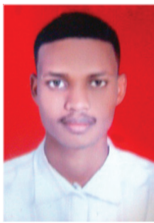
بقلم: المكاشفي مهدي

التقدم التقني في جميع أنحاء العالم جعل العالم قرية صغيرة لما فيه من سرعة التواصل والتراسل بين الدول وكذلك الدقة العالية في المعارف والمعلومات والتأكدات الأمنية عليها. كما مشهود الآن في جميع العلوم والمعاملات وأجهزة الإعلام والهواتف الذكية إلخ أنها تعتمد على أجهزة الحواسيب ، ولكن رغم هذا التقدم يبقى هناك سؤال يطرح نفسه وهو كيف نرتقي بالتقنيات الحديثة؟