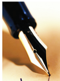
بقلم : منى على محمد

نشر المعلومات والبيانات عبرها وبالتالي أصبح على الداعية الإسلامي مسؤولية عظيمة في تبليغ ونشر الدعوة الإسلامية والدفاع عن الإسلام والردي على كل من يحاول تشويه الإسلام والمسلمين بنقل صورة خاطئة عنه، وفي هذا الصدد أصبحت المسؤولية كبيرة على الإعلامي خاصة والمسلمين خاصة وفي هذا قال: الدكتور أحمد زراع أستاذ الإعلام بجامعة الأزهر « إن