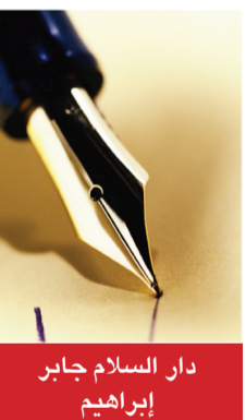
دار السلام جابر إبراهيم

نحن في عهد بعد الناس فيه عن زمن النبوة، وكل عام ترذلون ولا يأتي يوم وإلا والذي قبله خير منه، والذي بعده شر منه ظهر الفساد في البر والبحر وأصبح المعروف فيه منكراً والمنكر معروفاً وسميت الأشياء بغير أسمائها ومن ذلك ما نراه في الحدائق العامة من إختلاط وخلوة محرمة بغسم الحب ، والحقيقة هؤلاء الذئاب يخطون لإفتراس فريستهم ثم بعد العثور على مطالبهم يبحثون عن ضحية أخرى ، فلا بد للمسلمين أن ينبهوا الفتيات قبل أن تقع الفاس على الرأس ولا تنفع الندامة بعد ضياع الكرامة والعفة وصية غالية لكل فتاة من فتيات المسلمين .