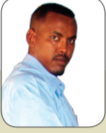
يكتبها سامر عوض السيد مالك