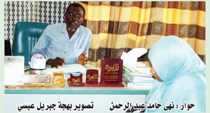
حوار : نهى حامد عبدالرحمن